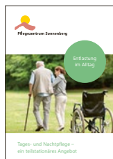
Entlastung im Alltag Tages- und Nachtpflege – ein teilstationäres Angebot

Weiterführende Informationen finden Sie in der separaten Broschüre: